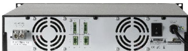
VA-P2120 - widok z tyłu