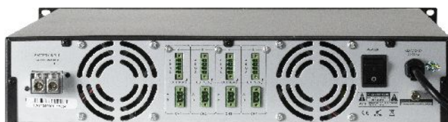
VA-P4500 - widok z tyłu