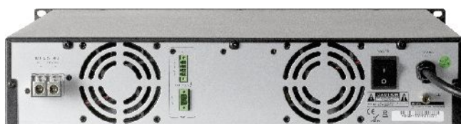
VA-P500 - widok z tyłu